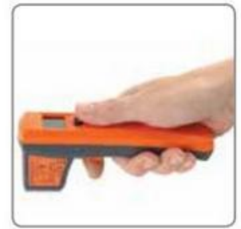
数字式激光温度计