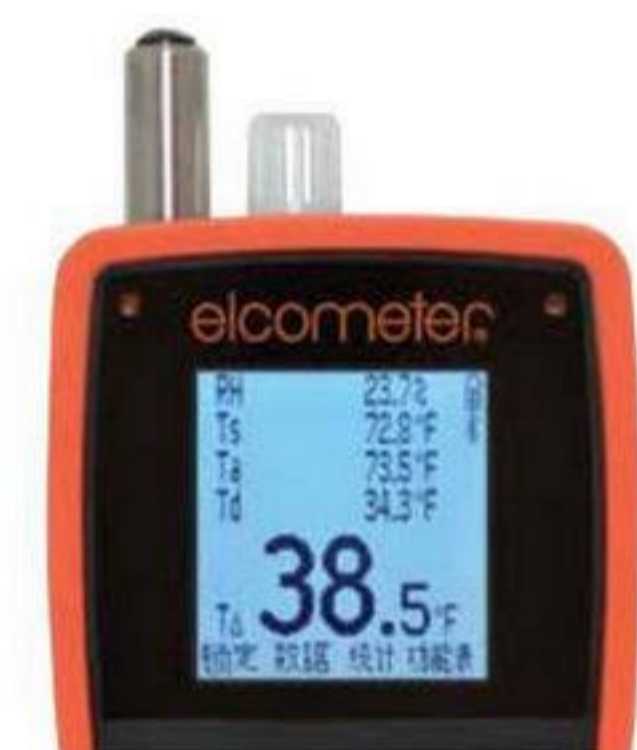
屏幕上查看多达5个用户可选的统计参数