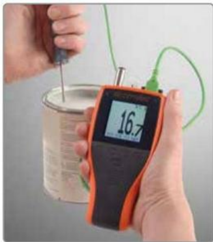
Te——适合用作单一温度计