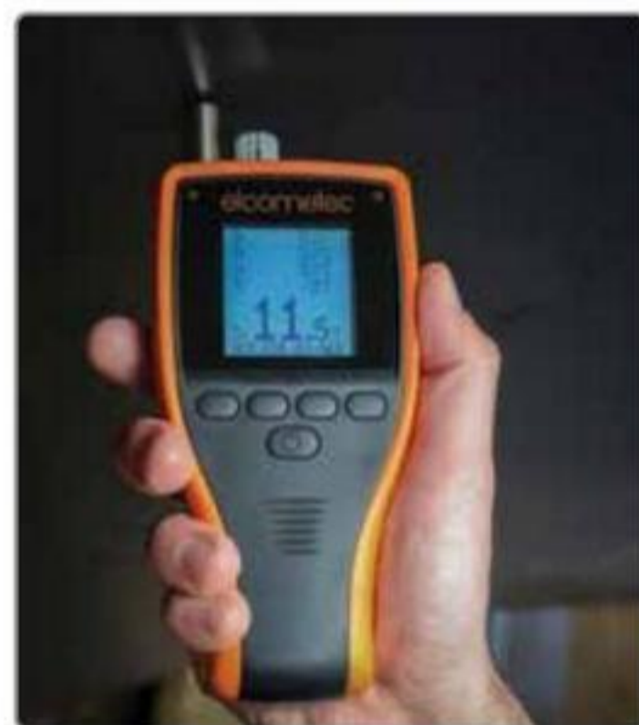
全密封传感器防尘防水 (相当于IP66)