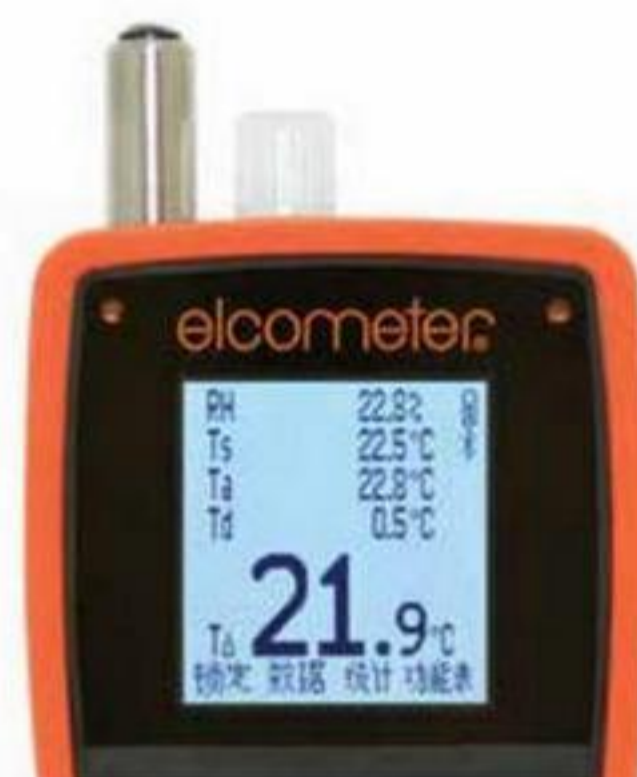
超大易读的测量数据，温度单位为°C 或 °F

BS 7079-B4, IMO MSC.215(82), IMO MSC.244(83), ISO 8502-4, US Navy NSI 009-32, US Navy PPI 63101-000