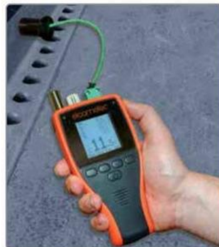
使用方便，菜单结构直观，多种语言可选