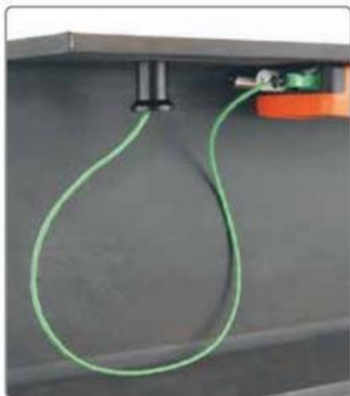
远程监控气候参数